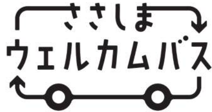
ささしまウェルカムバスのロゴ