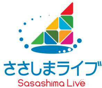
ささしまライブまちづくり協議会のロゴ